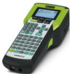
Impresora de transferencia térmica portátil para materiales en rollo

Tenga en cuenta que los datos indicados aquí proceden del catálogo en línea. Los datos completos se encuentran en la documentación del usuario. Son válidas las condiciones generales de uso de las descargas por Internet. ( http://phoenixcontact.es/download )